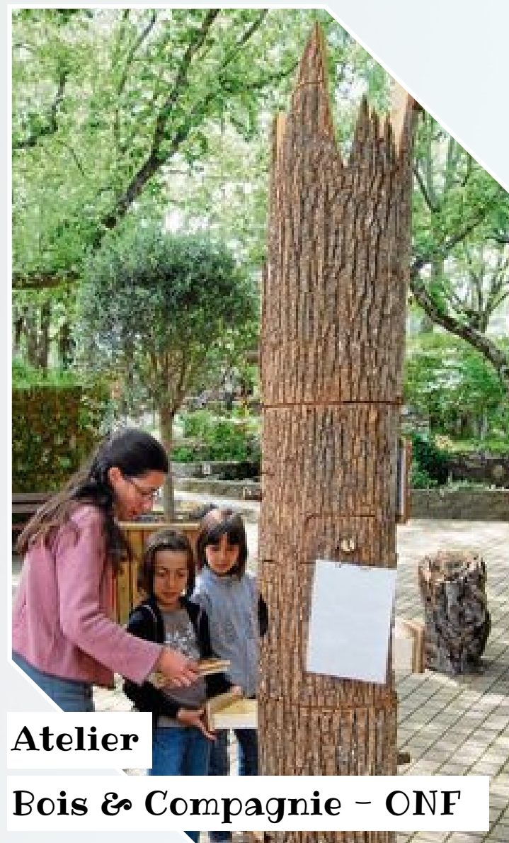
Atelier Bois & Compagnie - ONF

Enfants Atelier maquillage pour enfants en compagnie d'une maquilleuse professionnelle. Quel symbole du bois choisira votre enfant ? 10h00 - 12h00