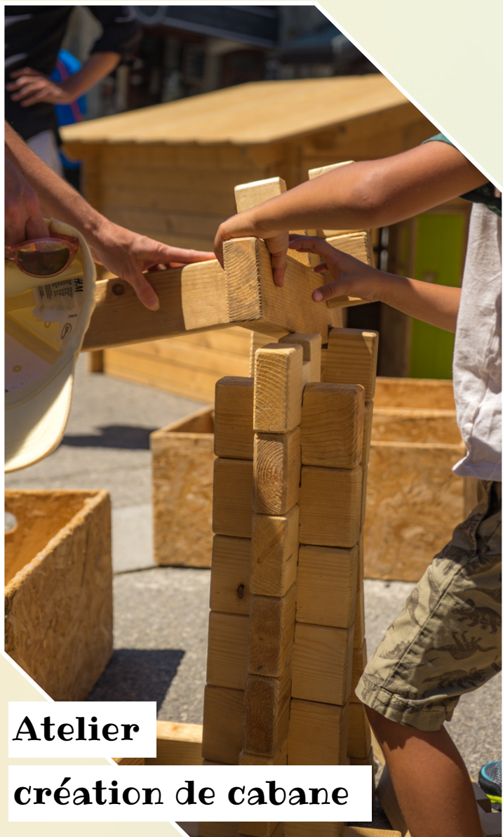
Atelier création de cabane

Spécial famille avec enfants Un rêve d'enfant devenu réalité avec cette animation ludique. L'objectif est simple: construire une cabane à l'aide de plans ! Un beau défis pour nos constructeurs en herbe ! Toute la journée