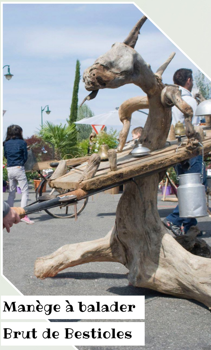
Manège à balader Brut de Bestioles

Enfants Création de carillons de bambous, mobiles nature faits de branches d'osier et autres branches, gîtes à abeilles et insectes ou autres créations diverses miniatures avec les éléments de la nature rapportés. 10h30 - 12h30 & 15h00 - 17h00