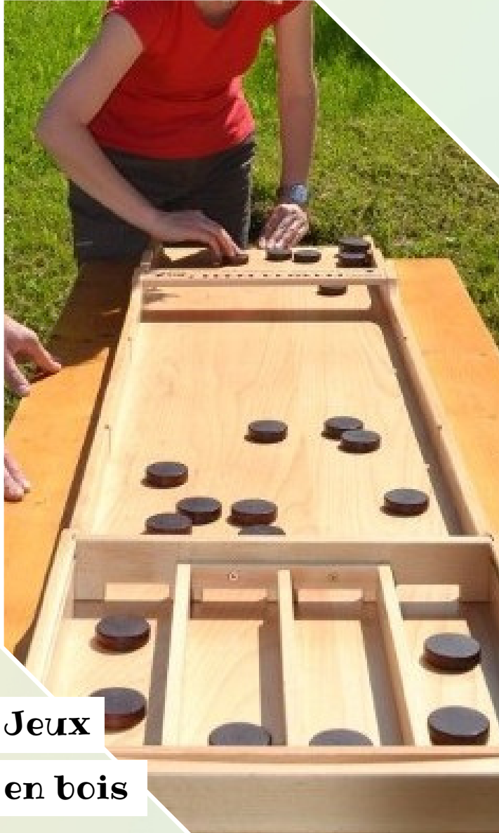
Jeux en bois