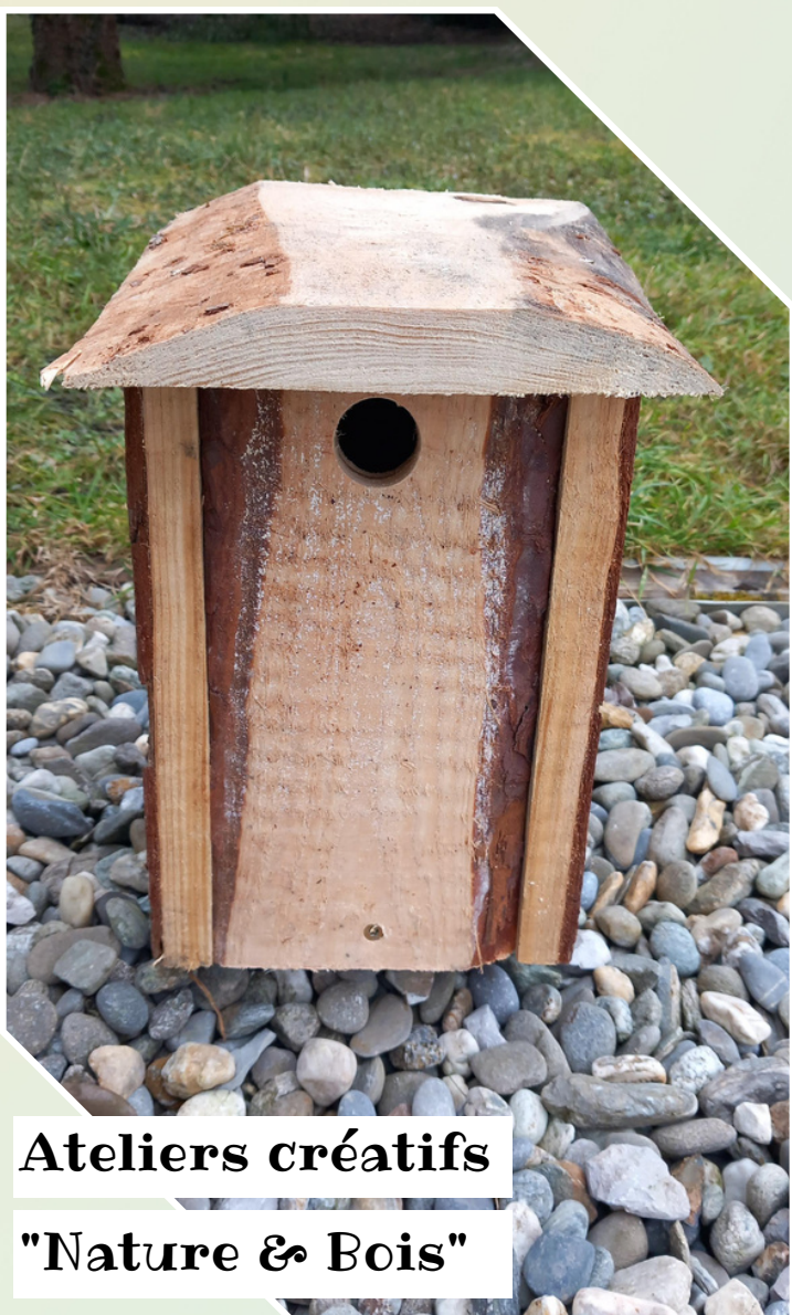
Ateliers créatifs "Nature & Bois"

Enfants Création de carillons de bambous, mobiles nature faits de branches d'osier et autres branches, gîtes à abeilles et insectes ou autres créations diverses miniatures avec les éléments de la nature rapportés. 10h30 - 12h30 & 15h00 - 17h00