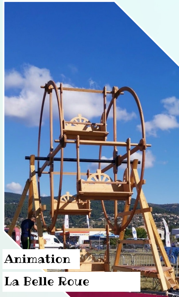
Animation La Belle Roue

Tout public Qui atteindra le mile? Venez vous défier lors de cette animation de lancer de hache. Celui qui aura le plus de points remportera la manche ! Ce jeu s'adapte à tous âge. 10h00 à 12h00 / 14h00 à 18h00 Réservation sur place