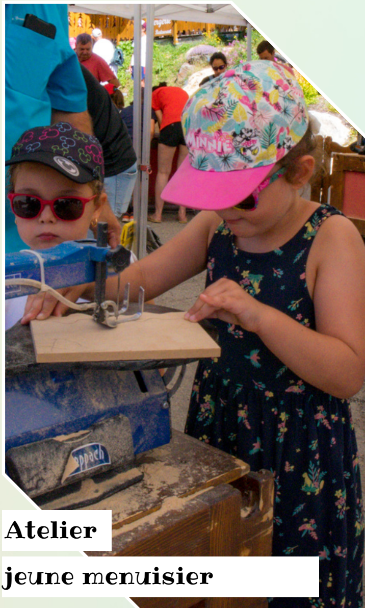
Atelier jeune menuisier

Spécial famille avec enfants Un rêve d'enfant devenu réalité avec cette animation ludique. L'objectif est simple: construire une cabane à l'aide de plans ! Un beau défis pour nos constructeurs en herbe ! Toute la journée