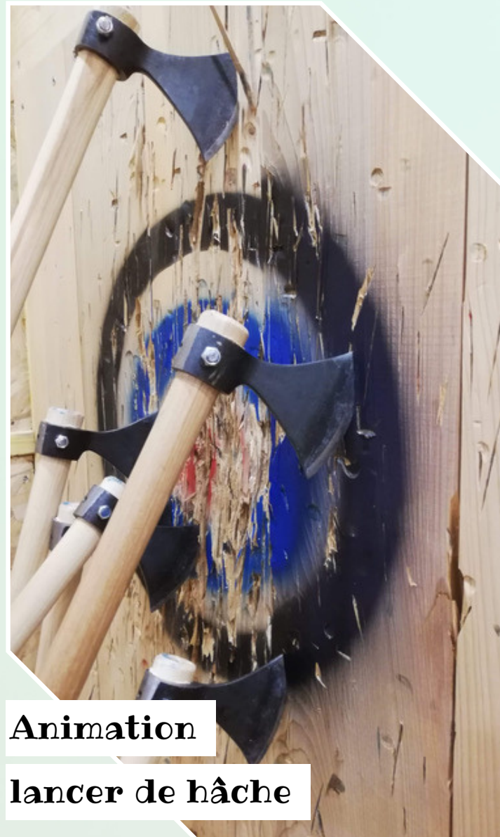
Animation lancer de hâche

Tout public Animation de menuiserie qui a pour but de créer sa propre figurine en bois. Un moment qui se veut ludique et instructif et qui permet aux petits et grands d'utiliser quelques machines pour l'occasion. 10h00 à 18h30