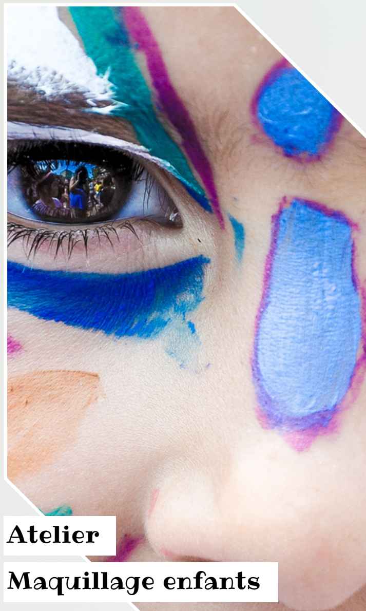
Atelier Maquillage enfants

Tout Public Sorti d'une fête foraine imaginaire, un savant-fou bricoleur débarque avec une horde de bizarreries fabriquées à partir de vieux bois. Entre jeux insolites, jeux d'adresse et jeux sonores, ces étranges créatures sont à découvrir impérativement !